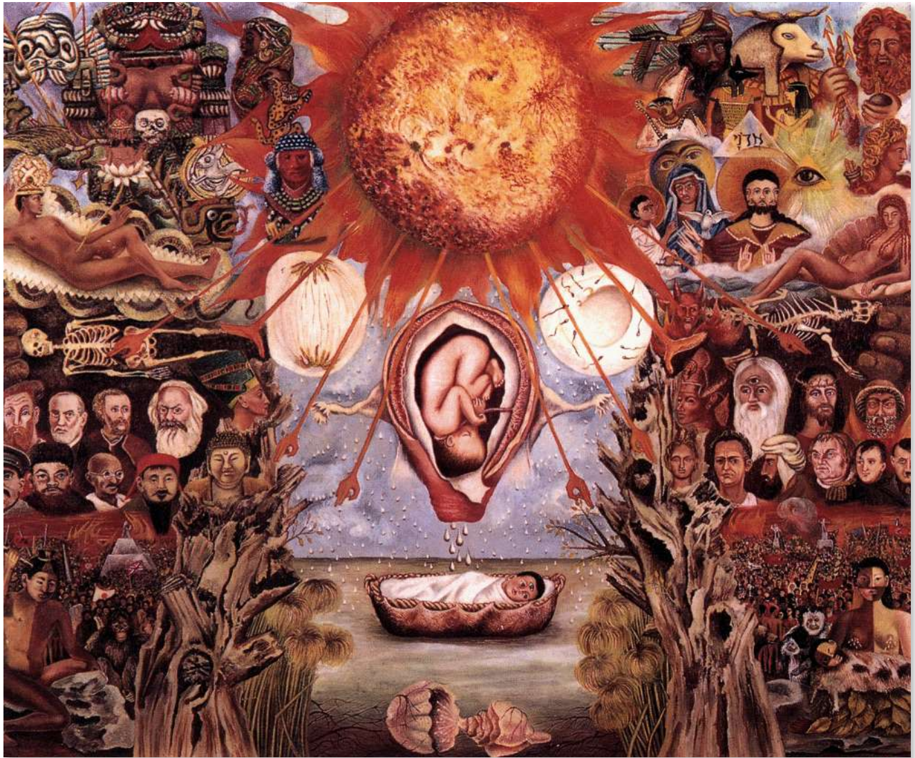
Moisés o el núcleo solar (1945). Óleo sobre tela. Colección privada

Frida Kahlo (1907-1954) es una de las pintoras mexicanas más importantes del siglo XX y una de las más reconocidas en el mundo entero. Su producción artística se caracterizó, principalmente, por la elaboración de cuadros autobiográficos en los cuales expresaba las dificultades a las que se enfrentó a raíz de una serie de infortunios vividos durante su juventud.