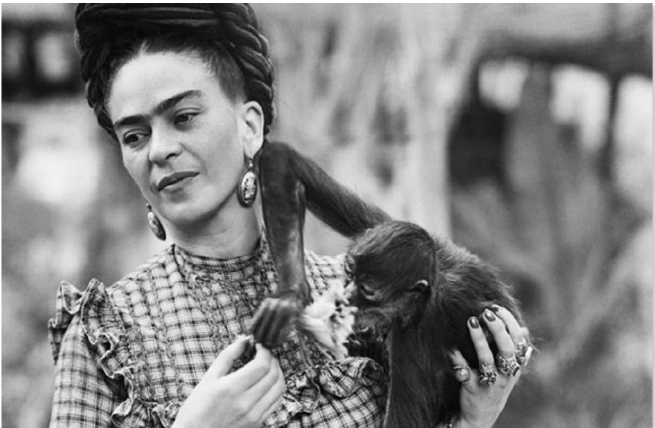
Frida Kahlo en 1944

Si bien la obra no consigue representar en su totalidad el complejo entramado de argumentos que expone Freud en su texto, Frida Kahlo retomó las figuras de Moisés y del Atón con sus representaciones características y expuso lo que, para ella, es la razón de existir de las religiones: la dicotomía entre la vida y la muerte.