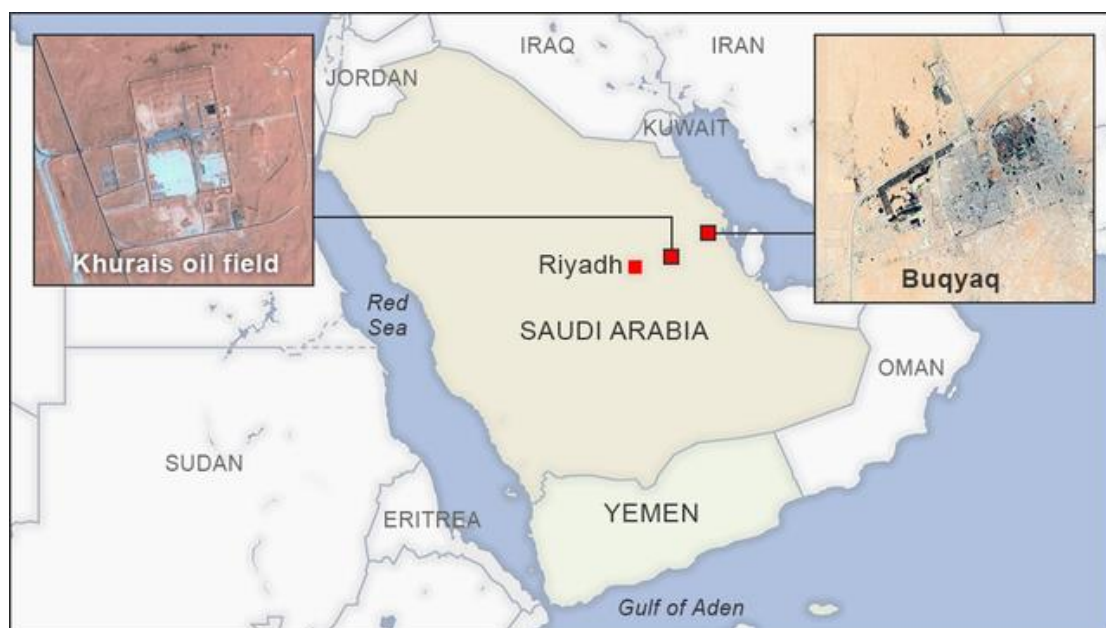
Los Ataques a Abqaiq y Khurais de 2019

Un ataque coordinado con misiles y vehículos aéreos no tripulados no es una teoría; Irán ya le hizo algo así a Arabia Saudita el 14 de septiembre de 2019, y este ataque causó un daño enorme a la capacidad de Arabia Saudita para exportar petróleo durante muchos meses. Esta fue probablemente la razón por la que Arabia Saudita La evasión de Arabia Saudita de unirse a los Acuerdos de Abraham y el factor que empujó a Arabia Saudita, junto con otras partes, a abandonar recientemente los entendimientos que tenía con Israel y unirse al campo iraní. Estados Unidos bajo la presidencia de Trump y Europa no hicieron nada contra Irán después del ataque en 2019, por lo que es seguro que hoy no harán nada mientras Biden sea presidente.