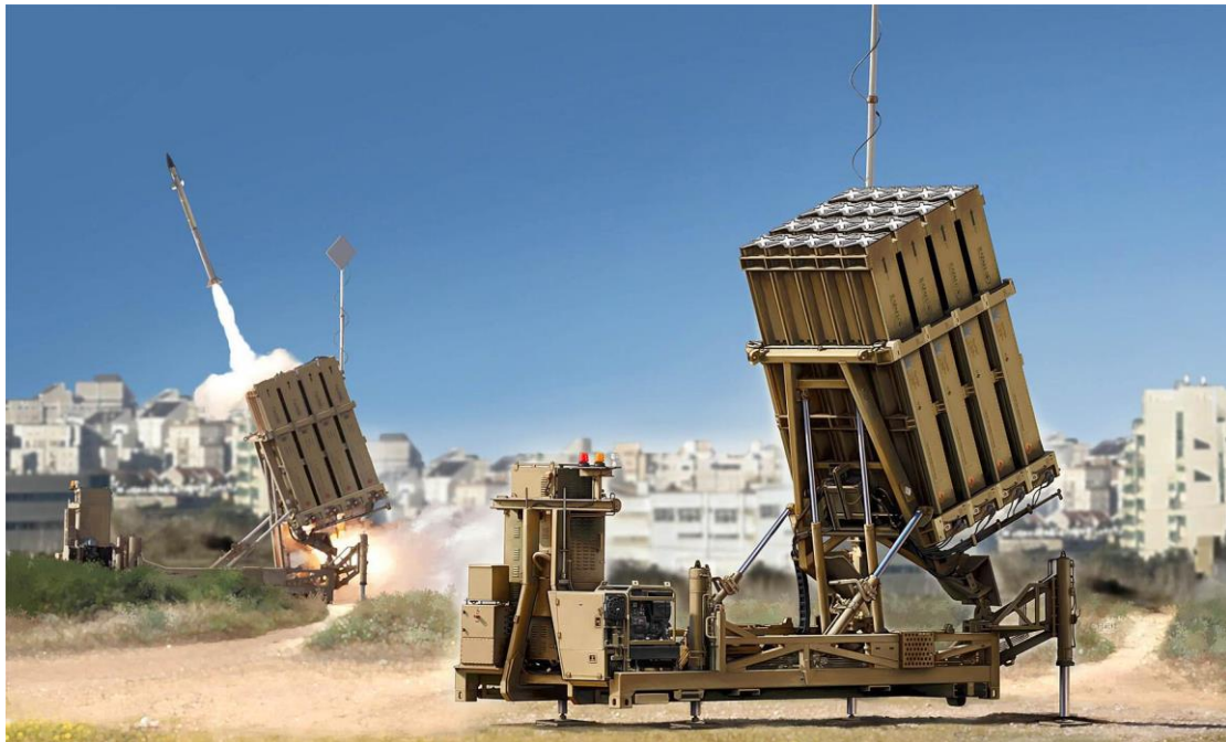
Sistema Iron Dome (Cúpula de Hierro) Activo desde 2011

Con el pretexto del deber del mundo musulmán de salvar la Mezquita Al-Aqsa de la ocupación y opresión israelí, Irán llevará a cabo un ataque organizado, integral, integrado y coordinado contra Israel. La primera fase será una lluvia de misiles y vehículos aéreos no tripulados de todas las arenas mencionadas juntas, y la estimación iraní es que el stock de interceptores de la "Cúpula de Hierro" se agotará dentro de dos o tres horas desde el inicio del ataque aéreo. después de lo cual los cielos israelíes estarán abiertos y la fuerza aérea será dañada y puesta a tierra.