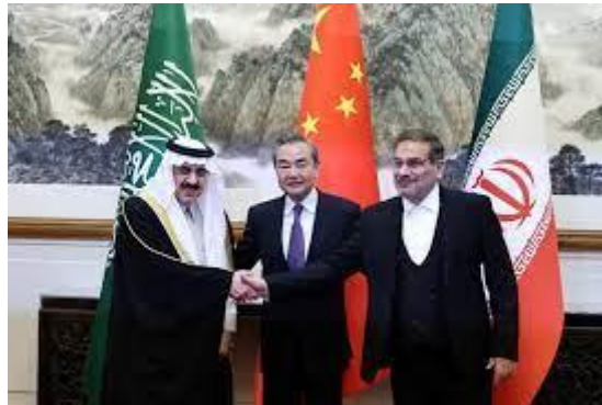
Firma del acuerdo para reanudar las relaciones diplomáticas entre Irán y Arabia Saudí

Rusia y China, los aliados de Irán, "llamarán a ambos lados a cesar la violencia", apoyarán a Irán casi abiertamente y le proporcionarán información sobre lo que está sucediendo en Israel. Turquía se unirá al llamado para cesar las acciones violentas pero implícitamente apoyará a Irán. En el mundo árabe e islámico, las multitudes saldrán a las manifestaciones de apoyo a Irán y su acción para eliminar la entidad sionista, similar al apoyo que las multitudes dieron a Hassan Nasrallah en la Segunda Guerra del Líbano, 2006. Esta vez, a diferencia de en 2006, Arabia Saudita no tomará una posición negativa hacia el ataque a Israel.